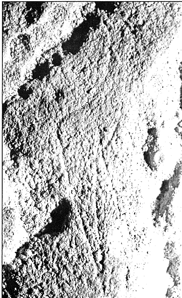
Silhouette féminine stylisée de 20 centimètres de haut.

Enfin, nous noterons la présence de signes claviformes, signes qui sont beaucoup plus courants dans les Pyrénées.