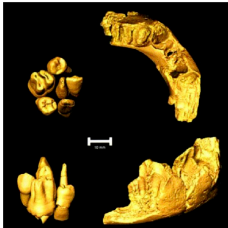
Scanners crâniens néanderthaliens du Moustérien Quina (doc. P. Bayle et B. Maureille) d'après Turq 2022).