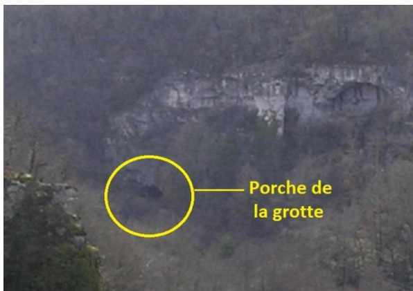
Porche de la grotte