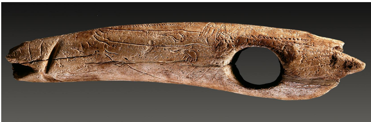
Raux - El Pendo, « bâton » perforé et gravé de têtes de biches et de signes.

The secular and the sacred: a subject that has been debated for a long time! Can we pretend to find the limit between these two perceptions? If there are limits, can we apprehend them in the vestiges of the Paleolithic? A little history of Prehistory allows us to better appreciate these data that marked the life of our ancestors.